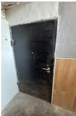
Iespējamās dzīvokļa ārdurvis.